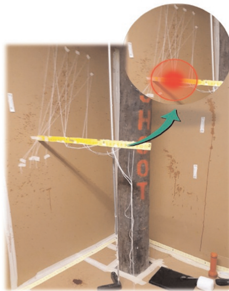
Figura 20. Área de origen